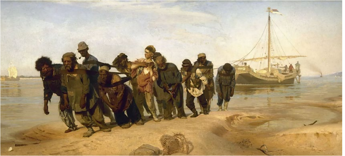
Iliá Repin, Los sirgadores del Volga , 1873.