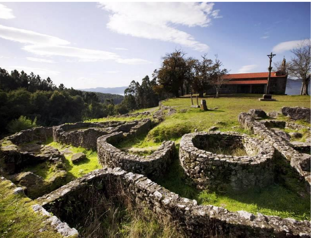
Castro de Troña, en Pías, (Ponteareas, Pontevedra).